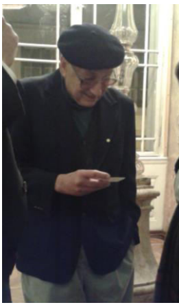
Abb.8:Dr. Walter Kohn