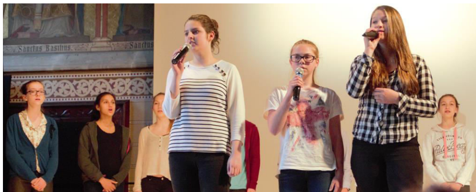
Abb.6: Schüler und Schülerinnen der 4a

Ja, irgendetwas muss sich ändern So kann das nicht weiter gehen Denn die Welt beginnt zu kentern Wie ein Schiff auf hoher See