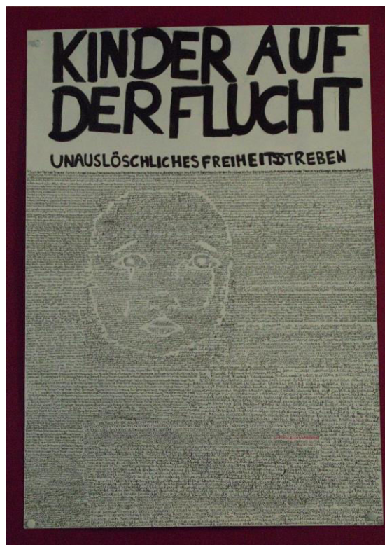
Abb.1: Bild von Lea, Caro, Ellen(4c)