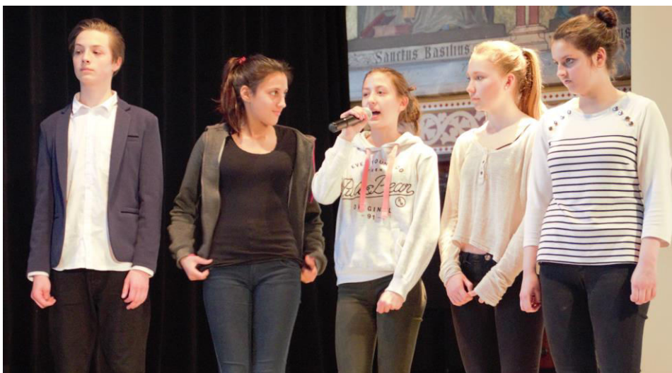
Abb.5: Schüler und Schülerinnen der 4a