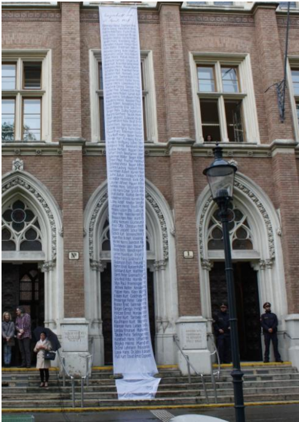
Abbildung 1: Namen aller "umgeschulten" Schüler und Lehrer

Im Anschluss an die Gedenkstunde gab es in den Klassen noch viele Gespräche über die Zeit des Nationalsozialismus und Antisemitismus aber auch über den Sinn und die Aufgabe solcher Gedenkfeiern.