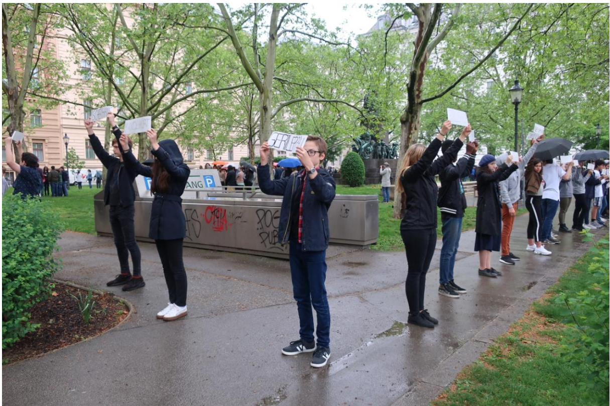
Abbildung 5: Schüler und Schülerinnen am Beethovenplatz