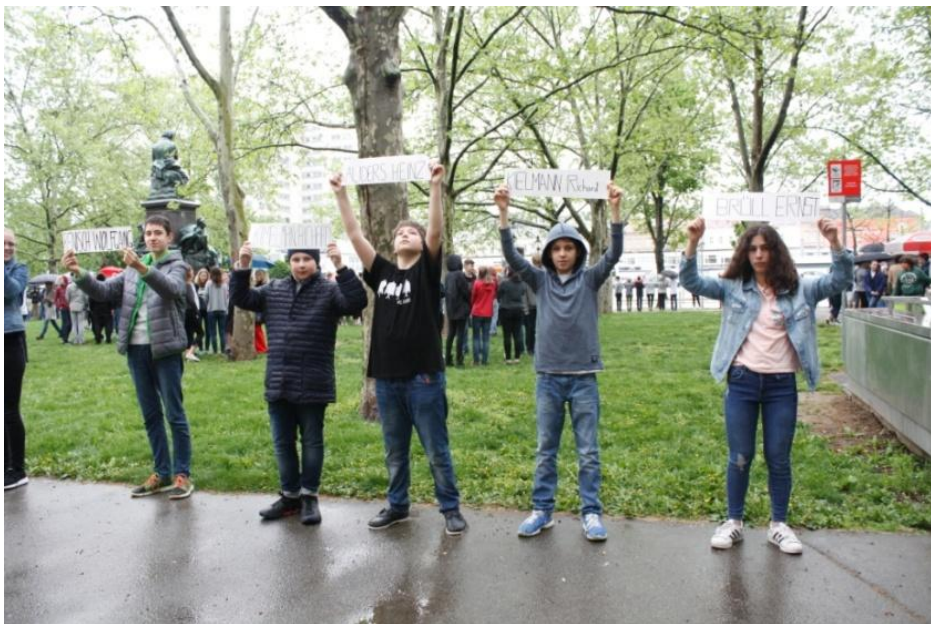
Abbildung 3: Schüler und Schülerinnen

Im Anschluss an die Gedenkstunde gab es in den Klassen noch viele Gespräche über die Zeit des Nationalsozialismus und Antisemitismus aber auch über den Sinn und die Aufgabe solcher Gedenkfeiern.