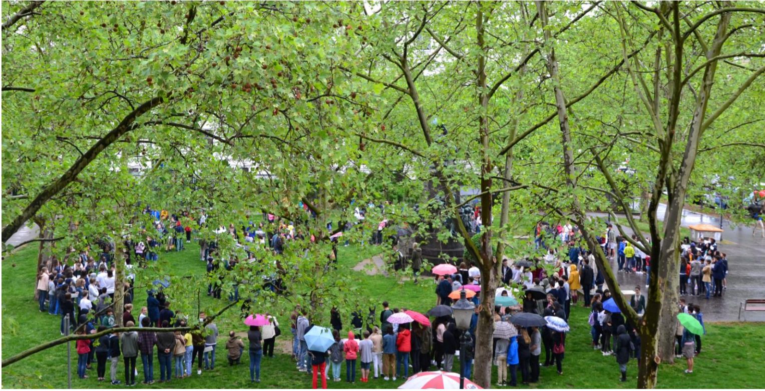
Abbildung 4: Schüler und Schülerinnen am Beethovenplatz