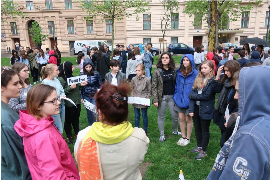
Abbildung 6: Schüler und Schülerinnen am Beethovenplatz