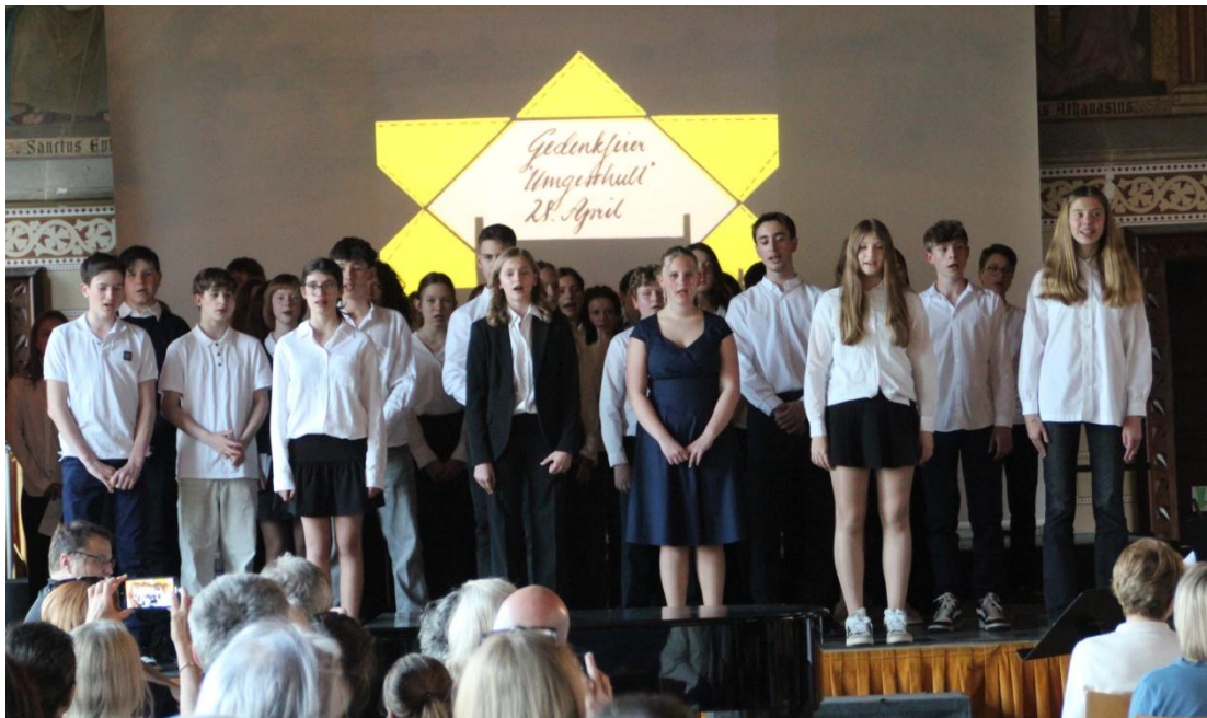
Abbildung 1: Klassenchor der 4B