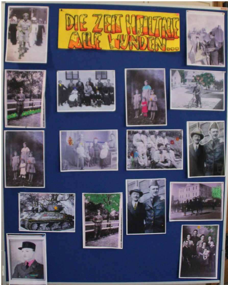
Abbildung 8: Collage von den Schülerinnen und Schüler (4A und 4B)