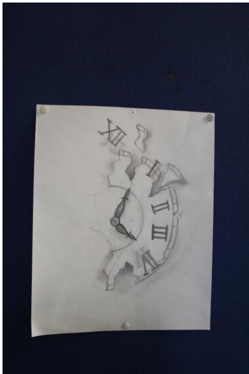
Abbildung 9: Michaela Boykova (4C)