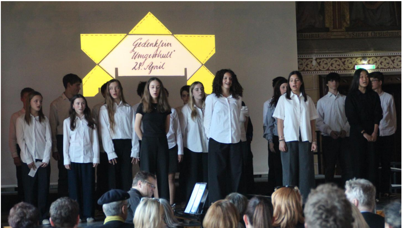
Abbildung 6: Klassenchor der 4A